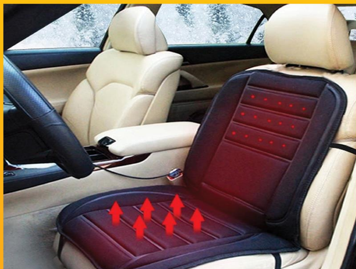
گرمایش خارجی (نصب بر رویه - موقت)